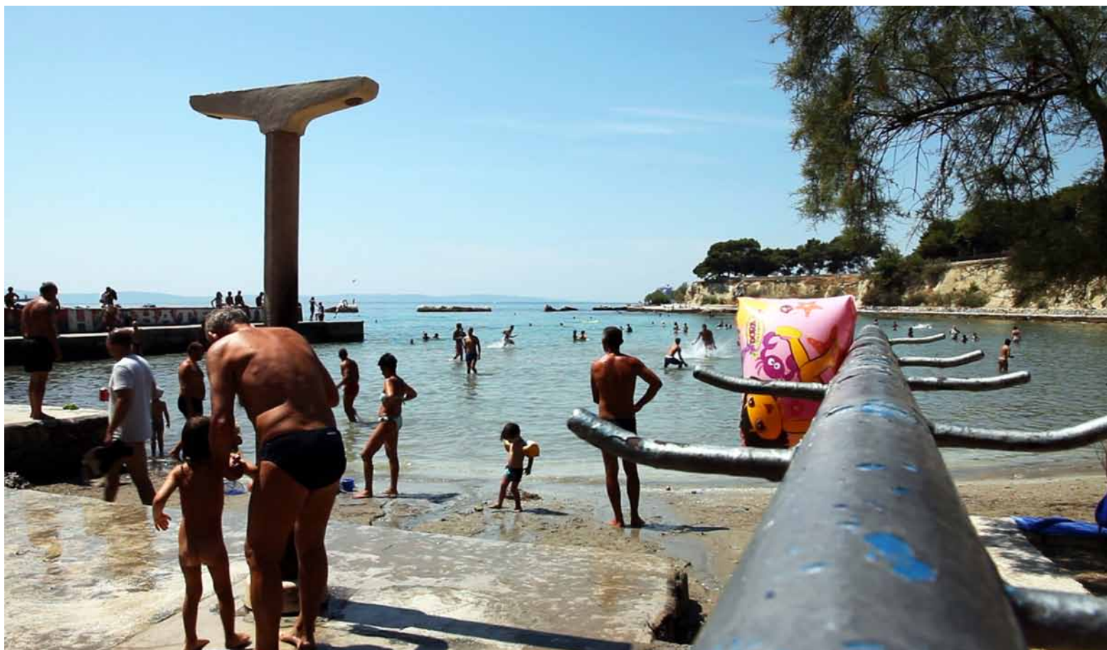
Firule, installation view, Kazamati, Osijek video installation, 4 channels, 3-10 min loop, 2012, silent