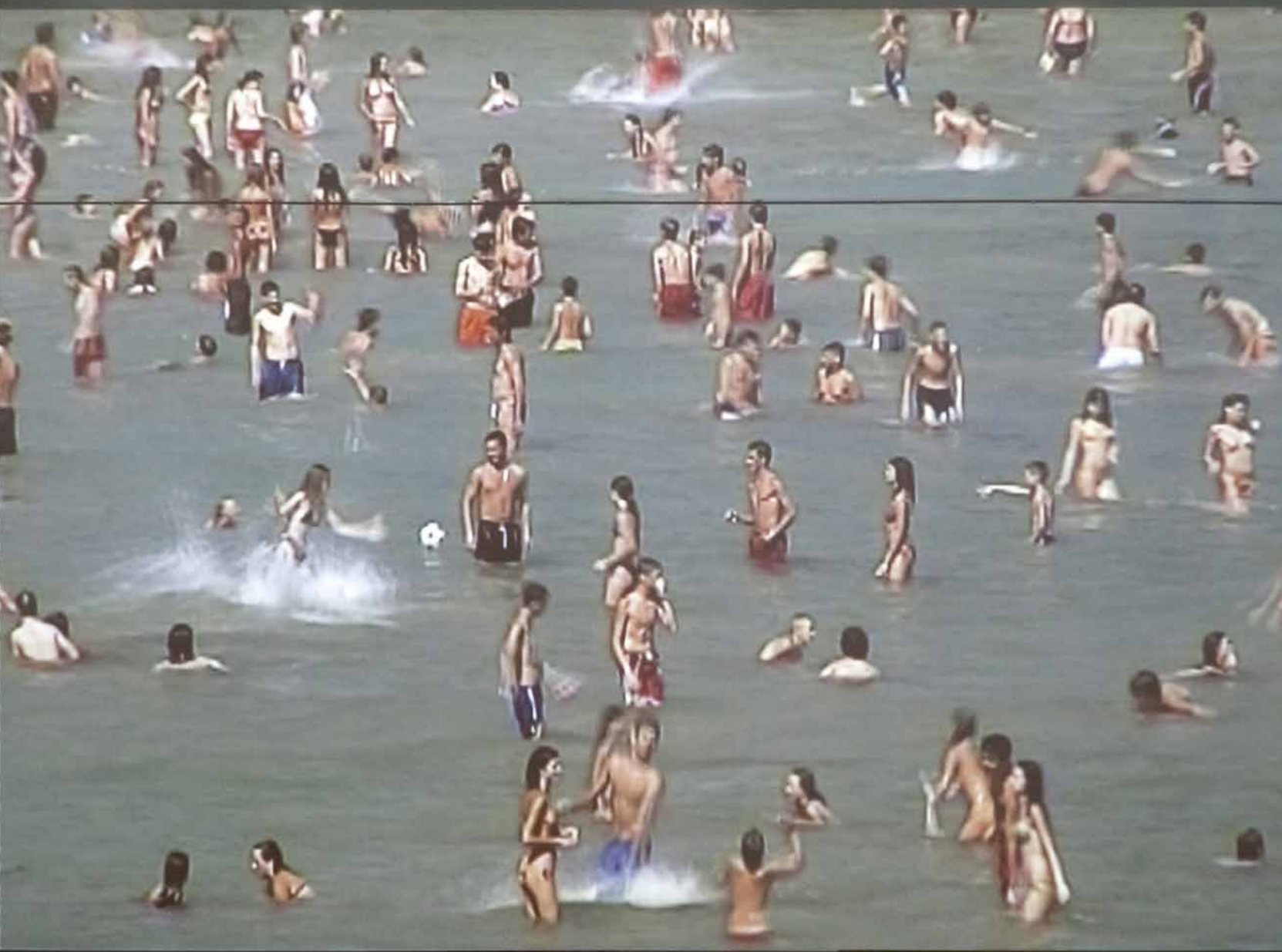
Generatio Aequivoca, installation view, MMSU Rijeka video loop, 5 min. 2008, silent