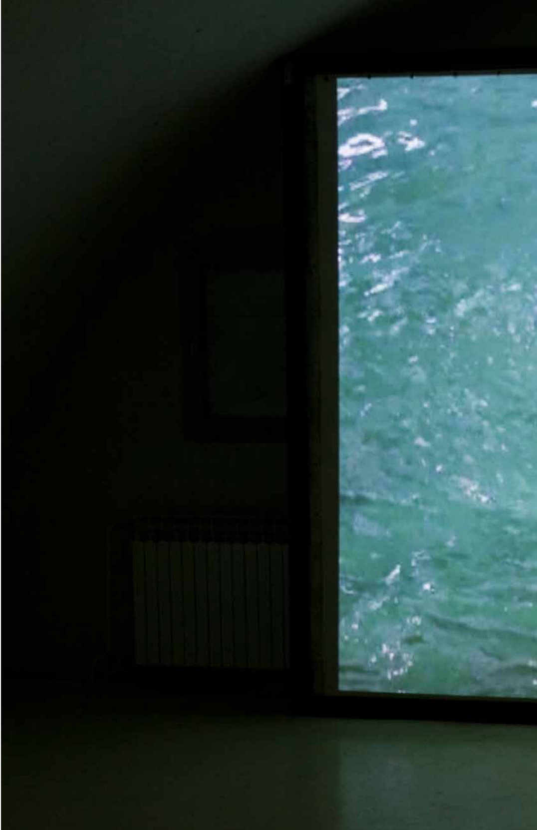
Satan Tango, installation view, Kazamati, Osijek 2 min loop, 2012, silent