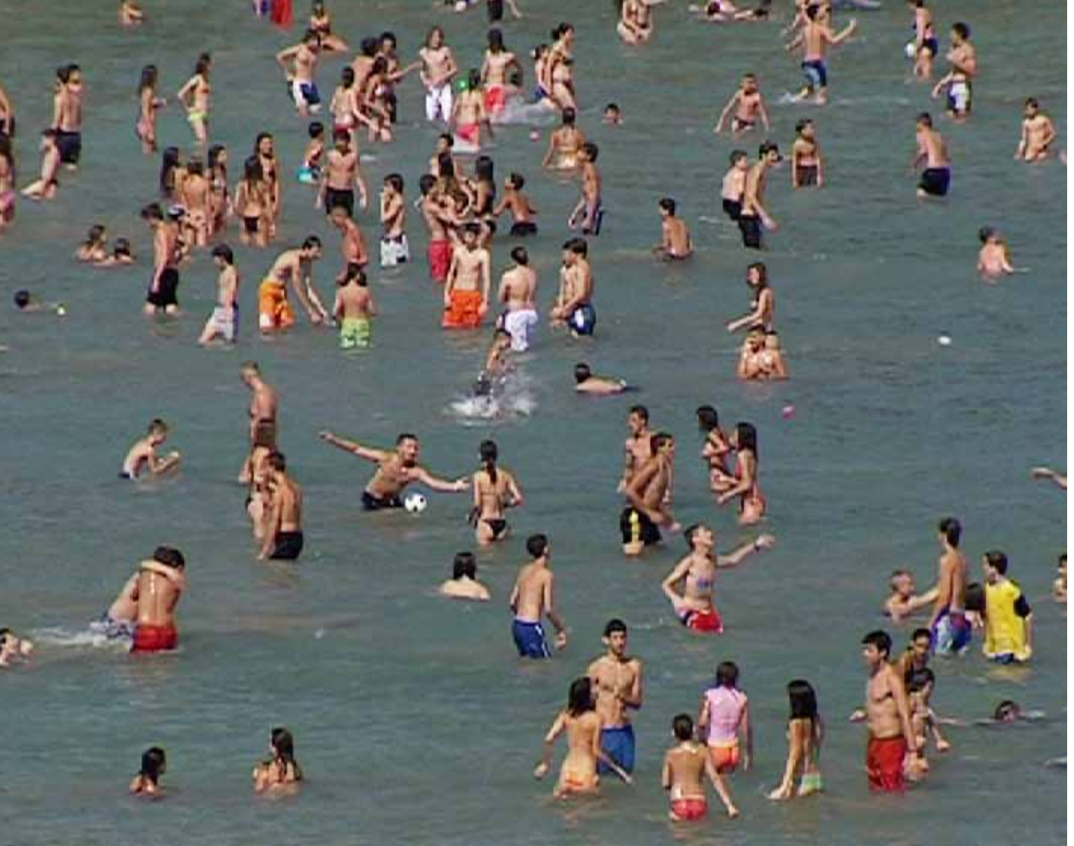
Generatio Aequivoca, still image, video loop, 5 min. 2008, silent