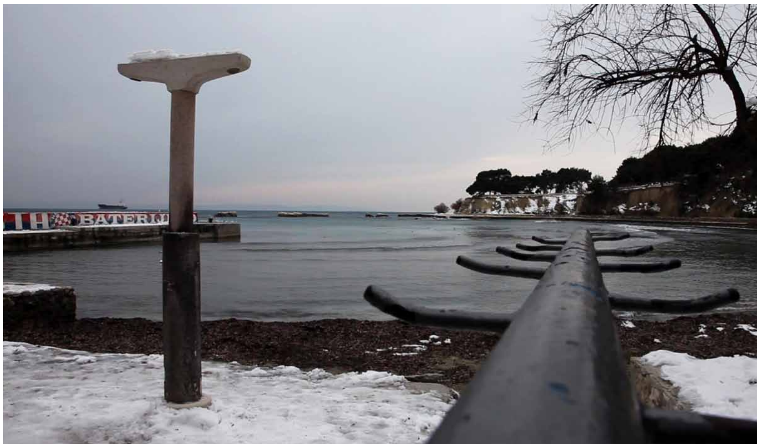
Firule, installation view, Kazamati, Osijek video installation, 4 channels, 3-10 min loop, 2012, silent