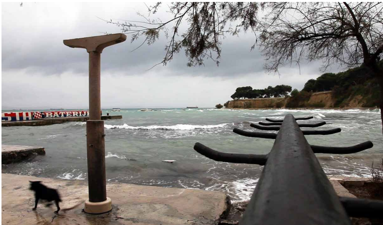
Firule, installation view, Kazamati, Osijek video installation, 4 channels, 3-10 min loop, 2012, silent