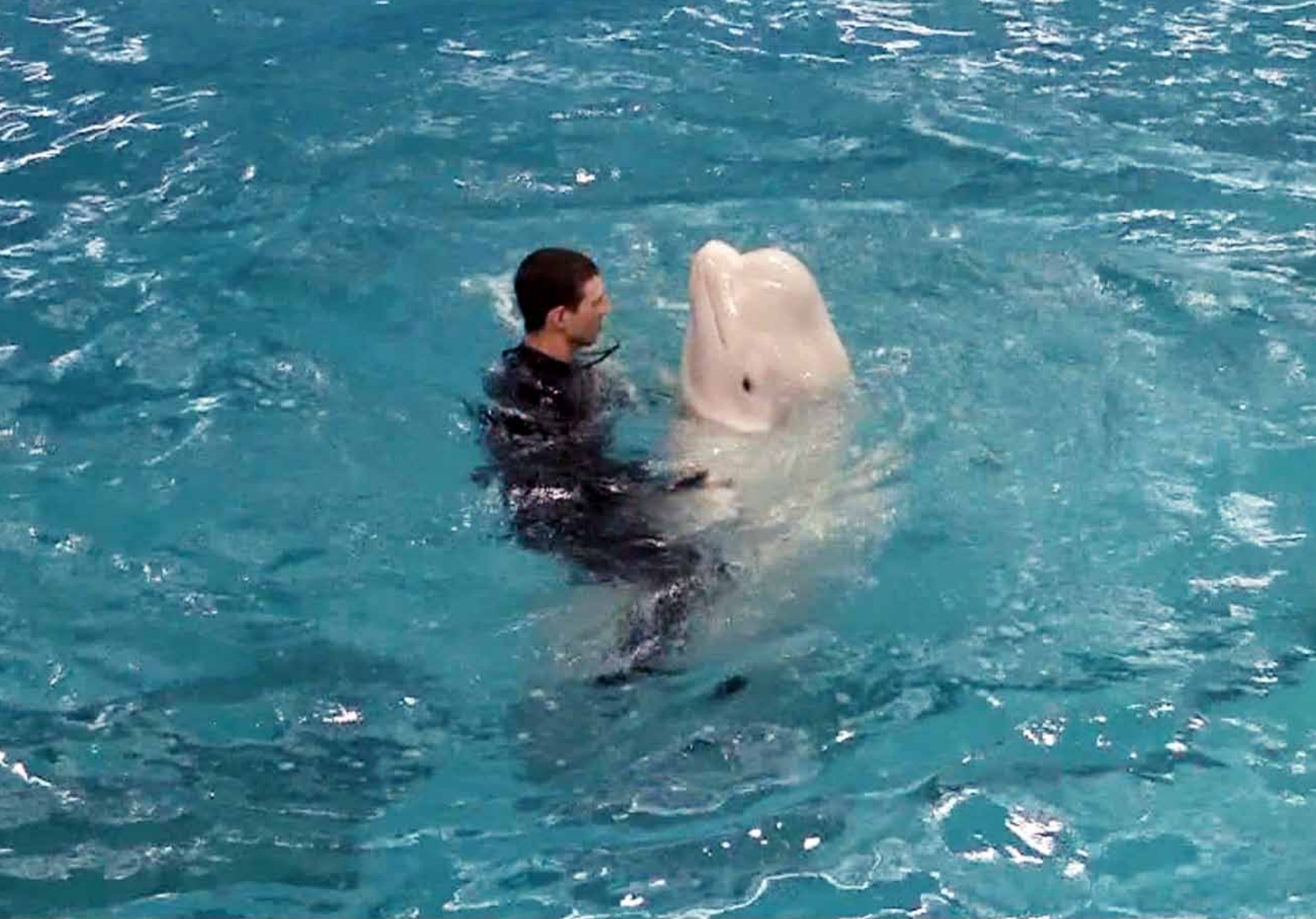
Satan Tango, still image video loop, 2 min., 2012, silent