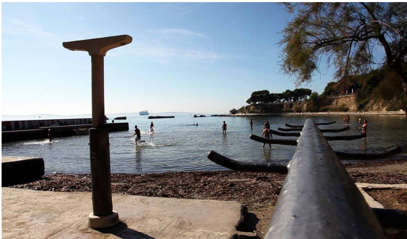
Firule, installation view, Kazamati, Osijek video installation, 4 channels, 3-10 min loop, 2012, silent