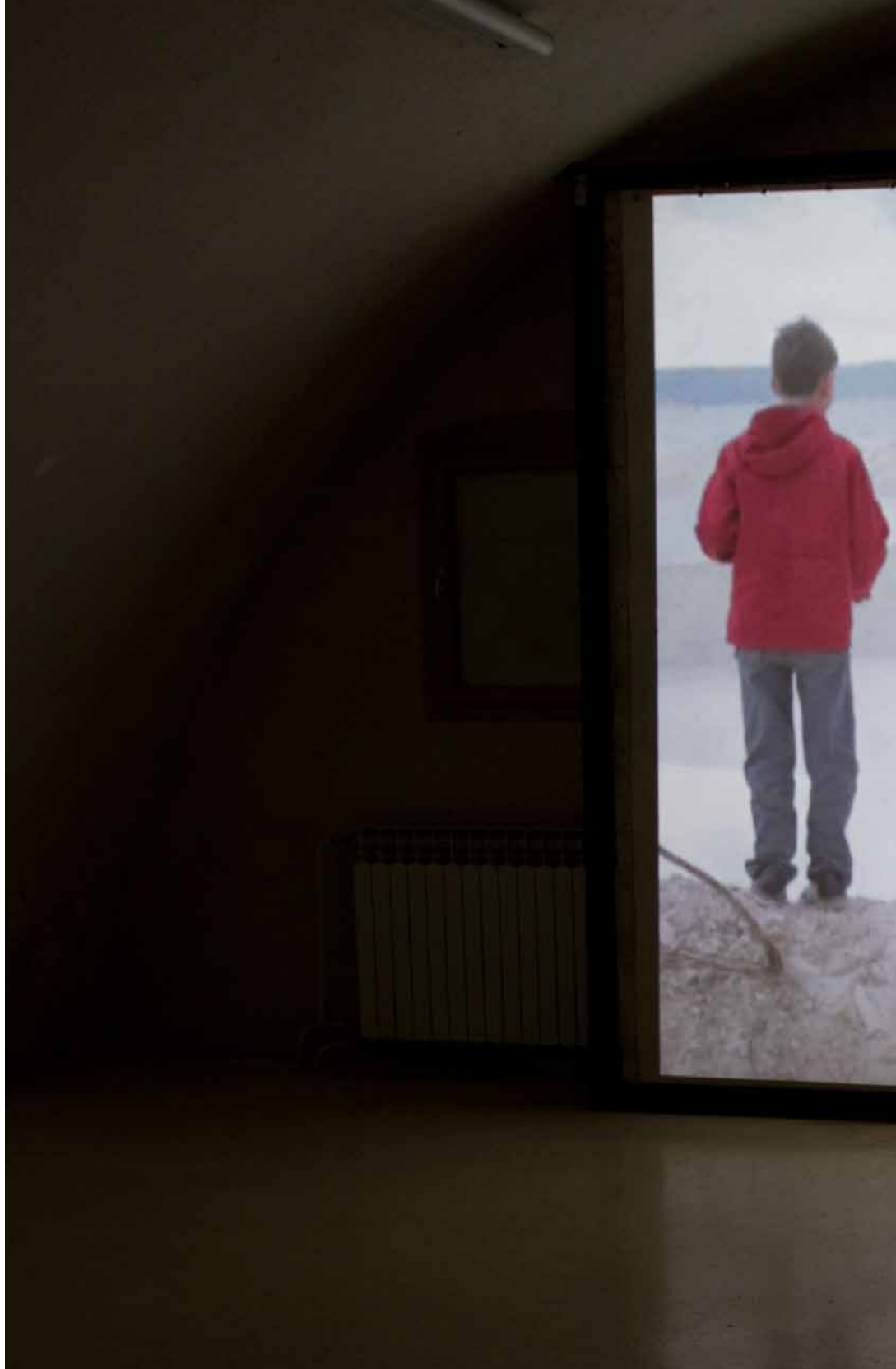
Post Festum, installation view, Kazamati, Osijek 5 min loop, 2012, silent