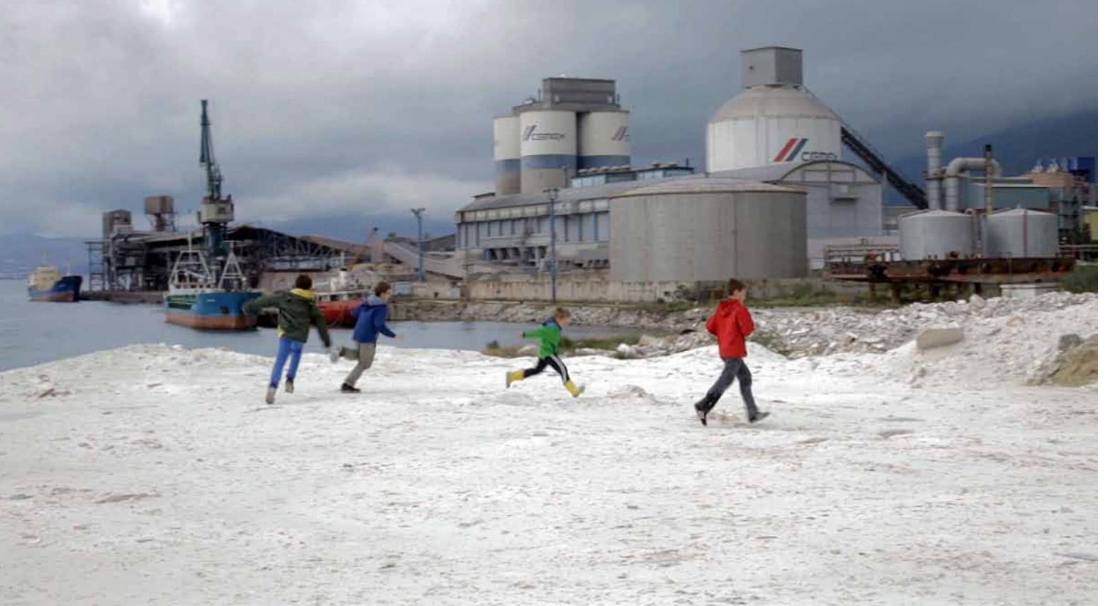
Post Festum, still image video loop, 5 min., 2012, silent